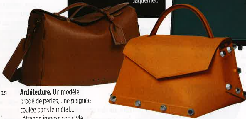
Architecture. Un modèle brodé de perles, une poignée coulée dans le métal... Létrange impose son style.