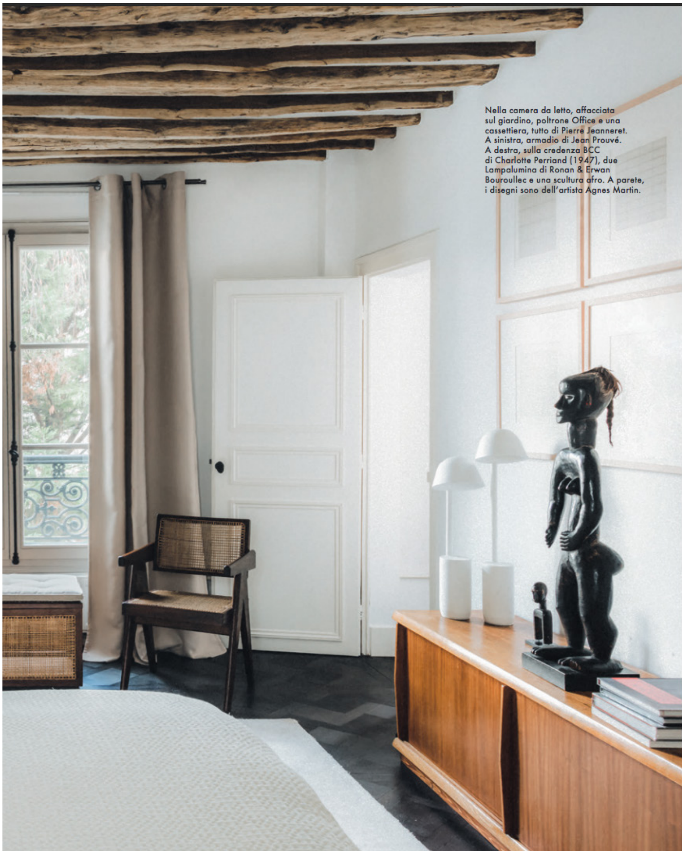
Nella camera da letto, affacciata sul giardino, poltrone Office e una cassettiera, tutto di Pierre Jeanneret. A sinistra, armadio di Jean Prouvé. A destra, sulla credenza BCC di Charlotte Perriand (1947), due Lampalumina di Ronan & Erwan Bouroullec e una scultura afro. A parete, i disegni sono dell'artista Agnes Martin.