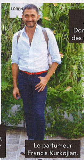
Le parfumeur Francis Kurkdjian.