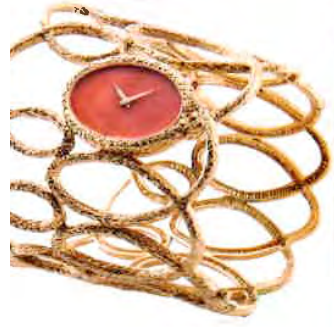
Montre bracelet femme or jaune et corail, vers 1970. Collection Gail et Robert Schwartz. Estimation : 20 000 € – 30 000 €