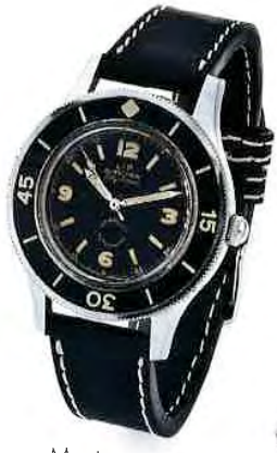
Montre Fifty Fathoms, de Blancpain