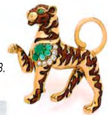
Van Cleef & Arpels Broche Tigre