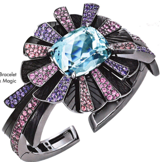
Bracelet Black Magic