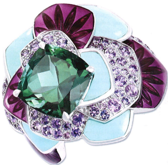
Bague Rêverie d'Été