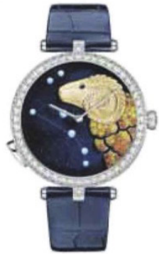
VAN CLEEF & ARPELS

Recréer le scintillement des étoiles. C'est ce que proposent ces douze montres de femme Van Cleef & Arpels inspirées par les signes astrologiques. À la base de cette prouesse technique: la piézoélectricité, soit la propriété de certains matériaux (dont la céramique) à se charger électriquement lorsqu'ils sont soumis à des